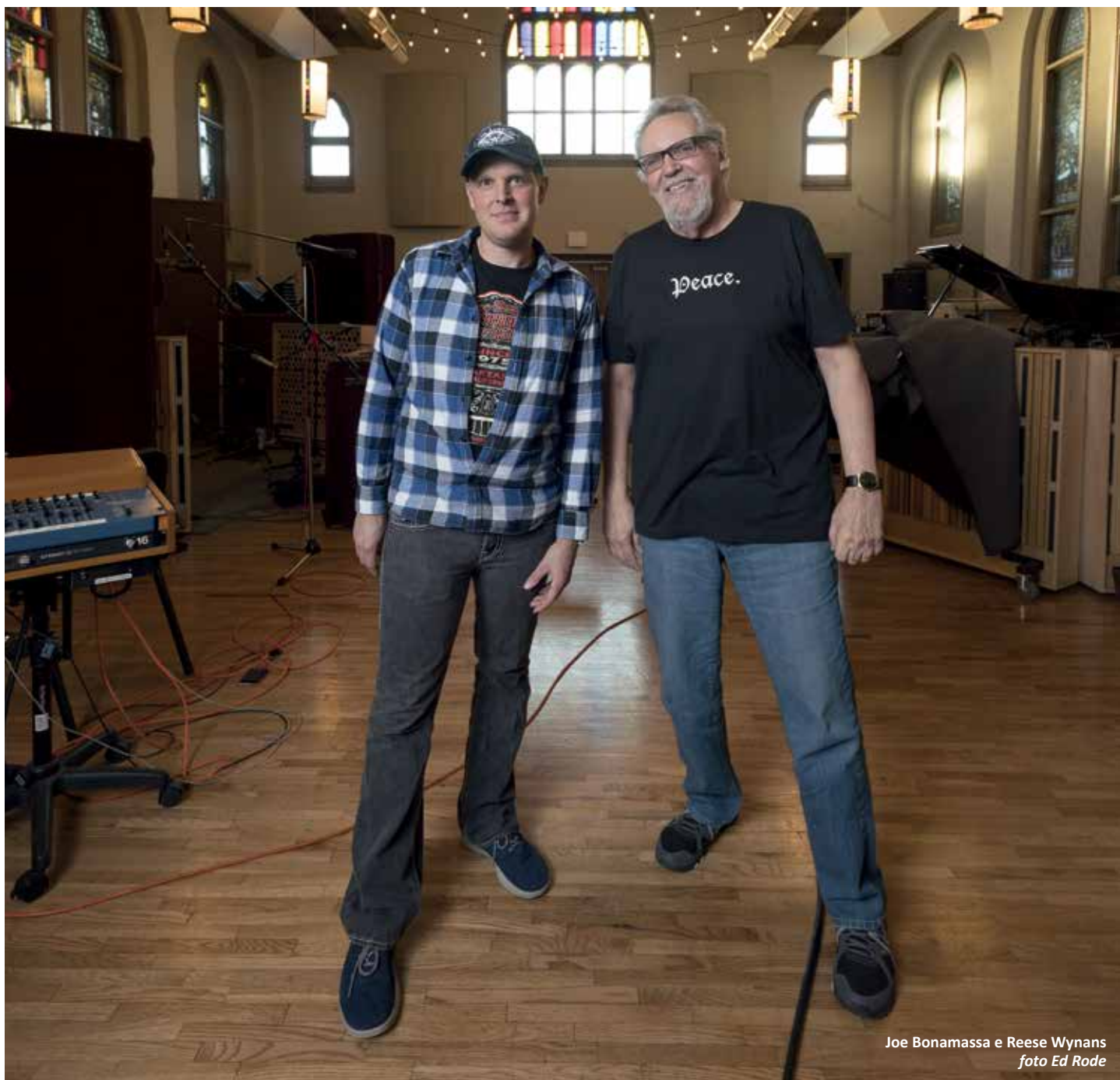
Joe Bonamassa e Reese Wynans